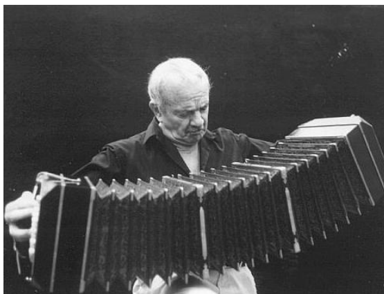
Piazzolla et son bandonéon

Piazzolla a mélangé tango traditionnel et musique moderne. Le tango se danse à deux, en mesure à 4 temps, née à la fin du XIXème siècle dans les tavernes le long du rio de La Plata qui sépare la Bolivie et l'Argentine.