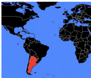
L'Argentine, capitale Buenos Aires